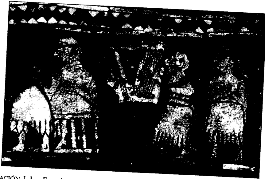
ILUSTRACIÓN 1.1 Estandarte de Ur, ca. 2600 a.C. En este detalle aparece una figura tocando una lira con forma de toro en un banquete de celebración de una victoria.

Los restos arqueológicos y las imágenes aún son cruciales para comprender la música de esta época. Las pinturas muestran cómo se sostenían y tocaban los instrumentos y en qué circunstancias se utilizaba la música, mientras que los instrumentos que han sobrevivido revelan detalles de su construcción. Por ejemplo, los arqueólogos que exploraron las tumbas reales de Ur, una ciudad sumeria junto al Éufrates, encontraron varias liras y arpas , dos clases de instrumentos de cuerda punteada, así como pinturas que muestran cómo se tocaban, todas aproximadamente del 2500 a.C. En una lira, las cuerdas van paralelas a la tabla armónica resonante y están unidas a un listón de ajuste apoyado en dos brazos; en un arpa, las cuerdas corren perpendiculares a la tabla armónica resonante y el mástil que las sostiene está unido directa-